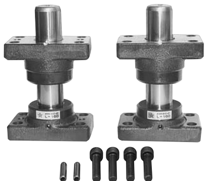
PYZP (ロック穴付無給油タイプ)