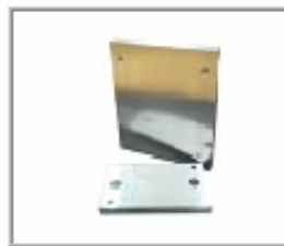
EDS-06 高精度 ベースプレート