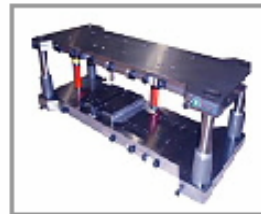
EDS-04 高精度用エコ ミックダイシステム