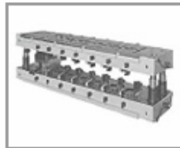
EDS-02 多工程用 エコダイシステム