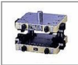
EDS-01M/01A エコミック ダイシステム